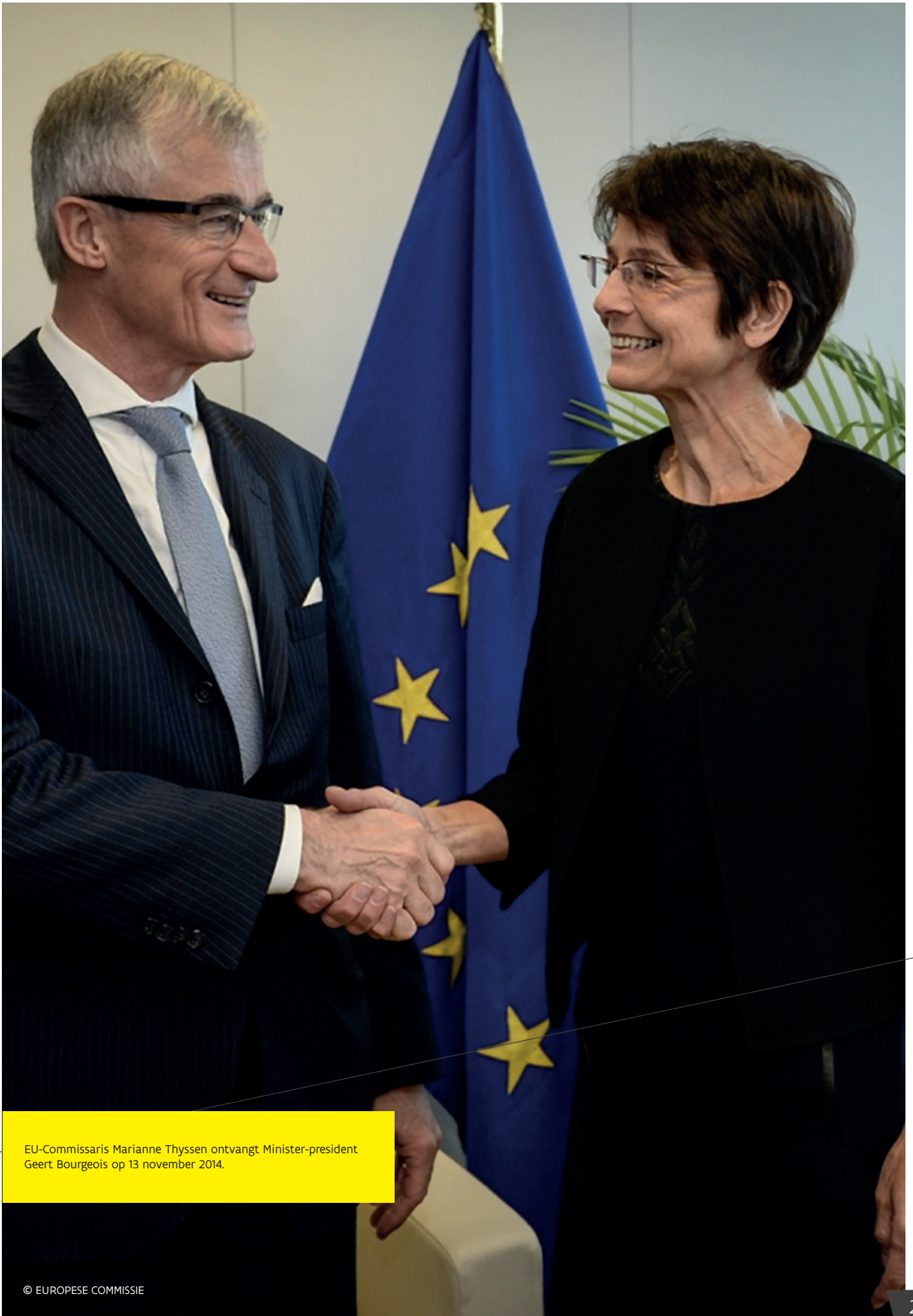
EU-Commissaris Marianne Thyssen ontvangt Minister-president Geert Bourgeois op 13 november 2014.