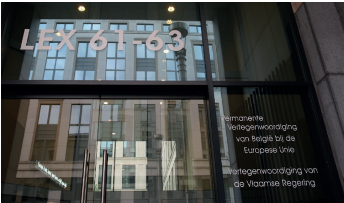
De Algemene Afvaardiging van de Vlaamse Regering bij de Permanente Vertegenwoordiging van België bij de Europese Unie.

Meer (gedeelde) EU-bevoegdheden hebben ook betrekking op onze deelstaatbevoegdheden (cohesiebeleid, gemeenschappelijk landbouw en visserijbeleid, energie, klimaat, transport, economie, innovatie, onderzoek, media, handel en investeringsbeleid enz.) dan op federale bevoegdheden. In België gaat bovendien het grootste aandeel van het EU-budget naar de deelstaten. Het is dus zaak dat Vlaanderen de rechtstreekse band met de EU versterkt en de gehele Vlaamse overheid zich een proactieve EU-reflex aanmeet.