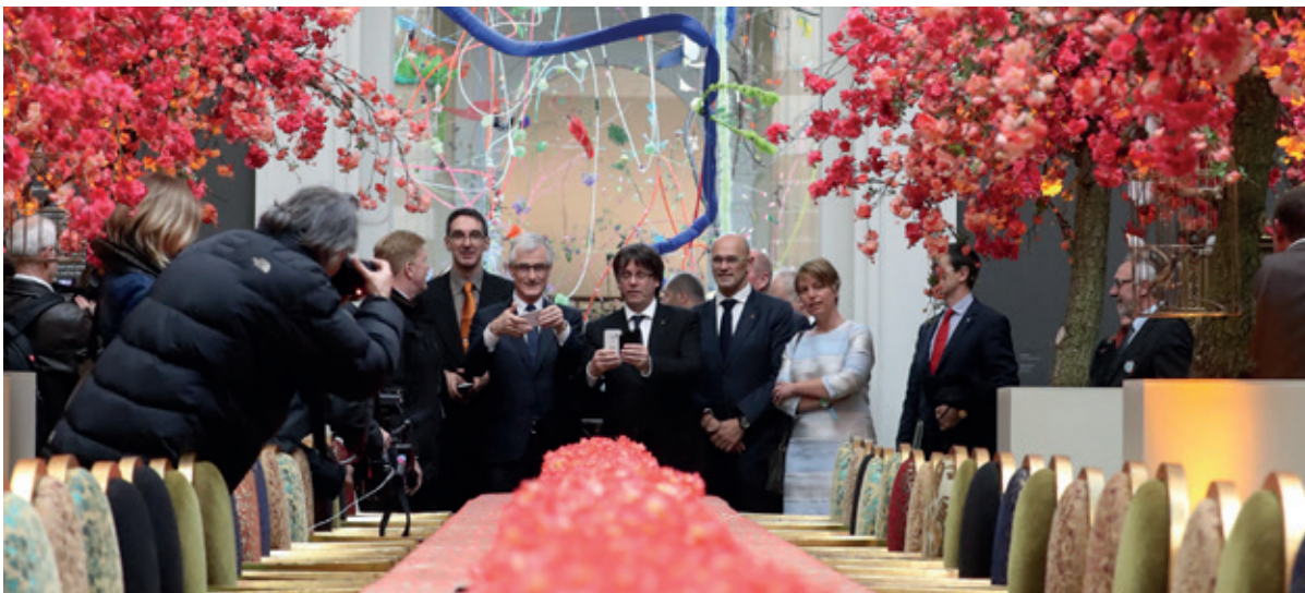
Minister-president van Catalonië, Carles Puigdemont, bezoekt samen met Minister-president Geert Bourgeois de Gentse Floraliën op 30 april 2016.

De Unie mag in geen geval uitgroeien tot een culturele eenheidsworst. We moeten wel verder inzetten op het creëren van verbondenheid binnen de EU, dit moet van onderen uit worden aangemoedigd via stedenbanden en jumelages, culturele samenwerking en uitwisselingsprogramma’s.