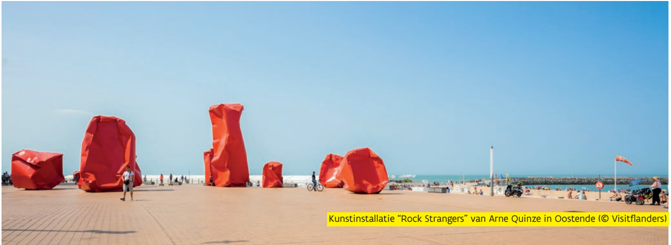
Kunstinstallatie "Rock Strangers" van Arne Quinze in Oostende