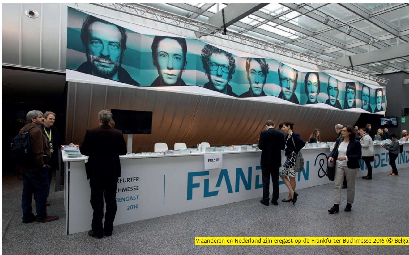
Vlaanderen en Nederland zijn eregast op de Frankfurter Buchmesse 2016

Sinds eind jaren 80 ontwikkelt de creatieve industrie zich, gemeten in omzet en werkgelegenheid, tot een van de meest dynamische sectoren van de Duitse economie. Deze sector speelt een pioniersrol in de "knowledge-based economy" en is een belangrijke bron van originele en innovatieve ideeën. Het ECCE, de European Centre for Creative Economy, dat op dit vlak tal van initiatieven neemt, is gevestigd in Dortmund. Vlaanderen is, via het Departement CJM, lid van het NICE netwerk, waarvoor ECCE het secretariaat verzorgt. De Vlaamse gamesector is jaarlijks met een beursstand aanwezig op Gamescom in Keulen om de Vlaamse sterktes onder de aandacht te brengen.