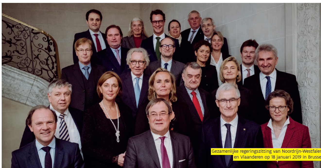
Gezamenlijke regeringszitting van Noordrijn-Westfalen en Vlaanderen op 18 januari 2019 in Brussel

Zowel de Duitse federale Regering, de Länder als Vlaanderen zijn pleitbezorger van subsidiariteit in de Europese Unie. Daarbij moet de meerwaarde van Europees optreden steeds aangetoond worden. Vlaanderen wil samen met de Duitse federale Regering en de Duitse Länder het momentum aangrijpen om in de Europese instellingen het respect voor het subsidiariteits-principe een meer centrale plaats te geven in het Europees beleid.