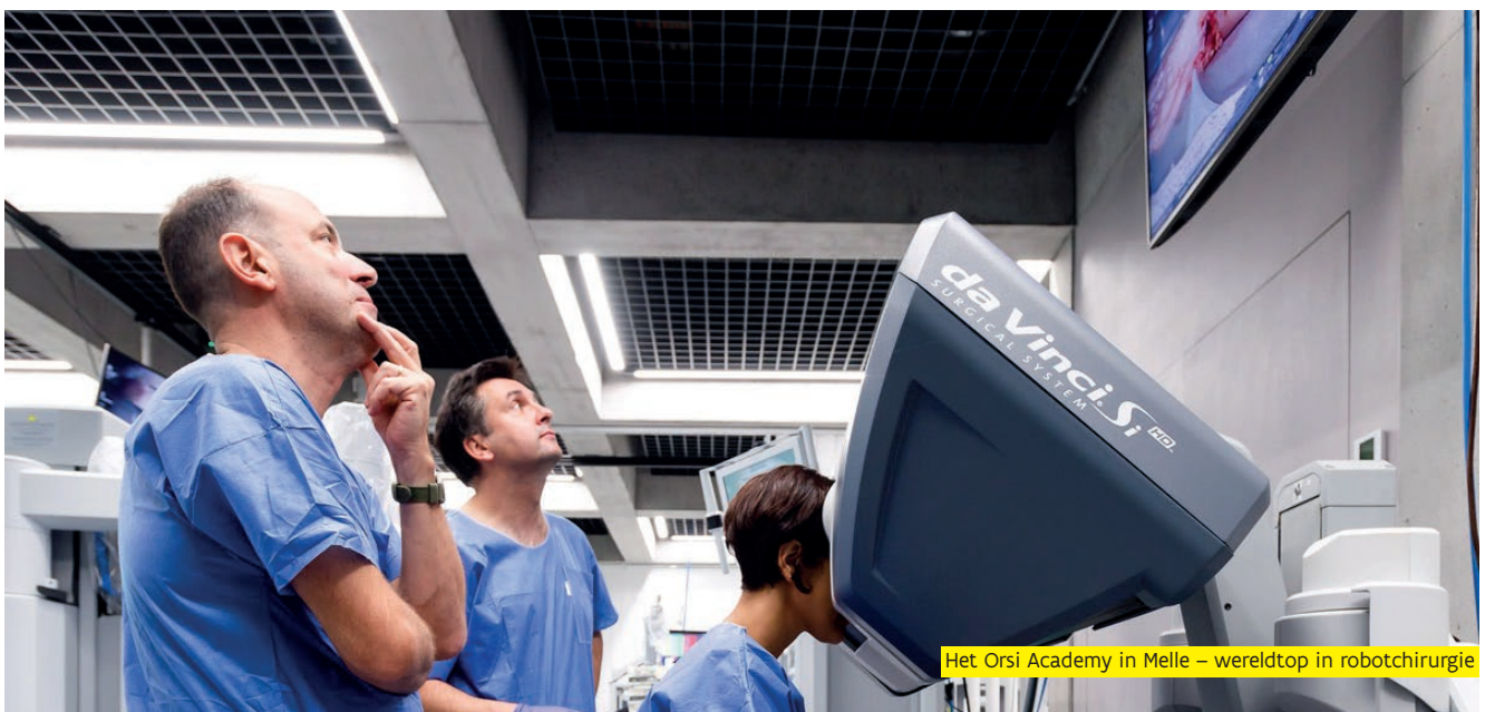
Het Orsi Academy in Melle – wereldtop in robotchirurgie